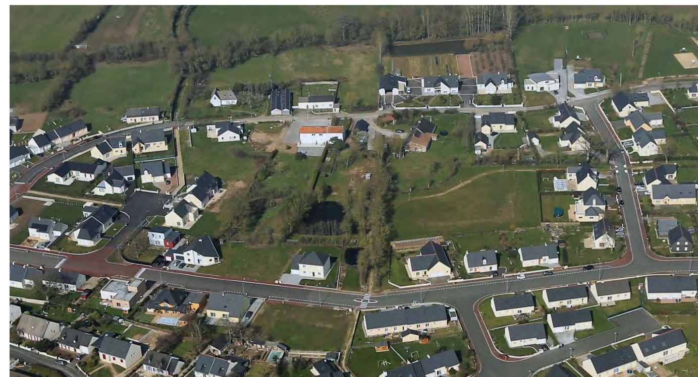
VUE AERIENE (2013)

Préserver les éléments du paysage : maille bocagère, mare existante.