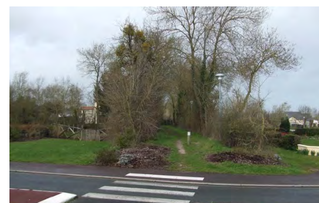
Le chemin pédestre depuis l'av du Roussillon