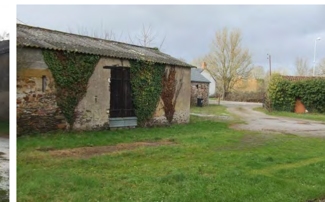
le chemin à condamner