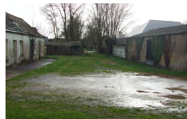
l'axe du chemin carrossable à créer et l'annexe à préserver