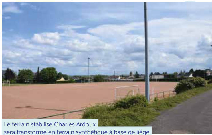
Le terrain stabilisé Charles Ardoux sera transformé en terrain synthétique à base de liège

En complément de ces équipements, 6 couloirs d'athlétisme de 70 m seront installés à proximité du terrain engazonné du Bois Jauni, pour les scolaires, avec un bac à sable en bout de pistes pour la pratique du saut en longueur. Le stade engazonné Charles Ardoux se verra également doté d'un éclairage.